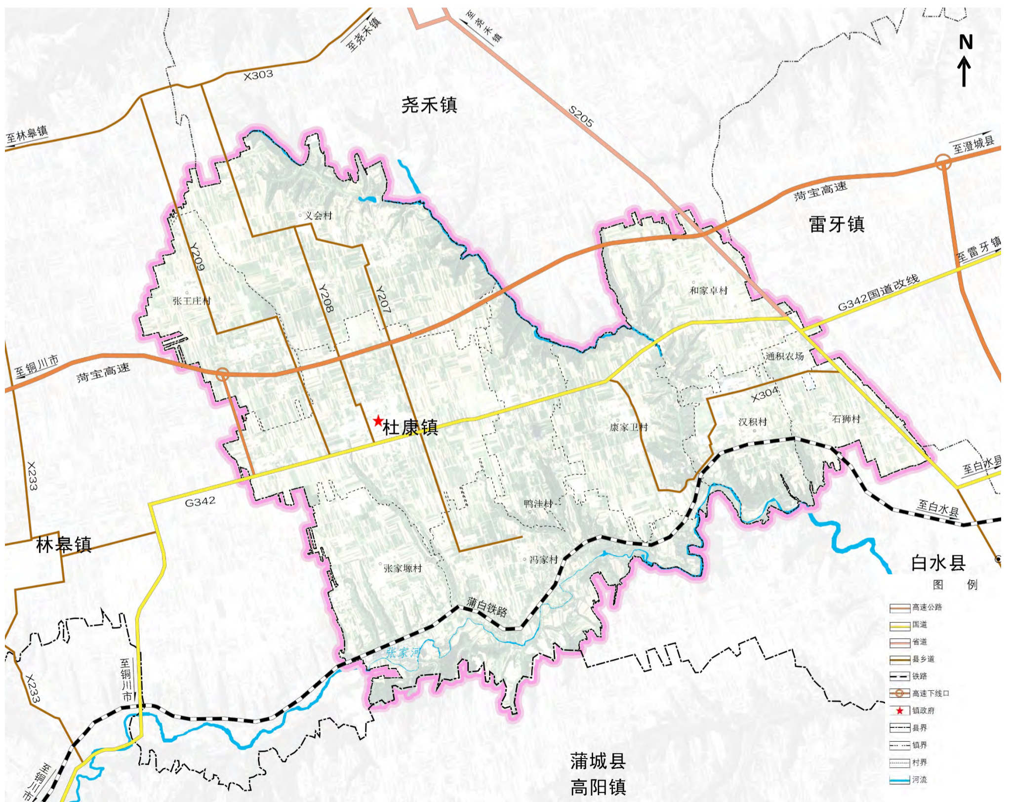
全域综合交通规划图

城乡公交 推进杜康镇与白水县城区客运的公交化运营，规划沿G342形成与杜康镇、雷牙镇、林皋镇及白水中心城区有效联络的旅游公交环线。