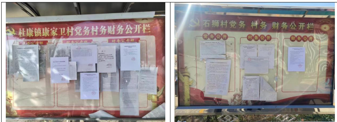
图 5 项目征求意见稿现场张贴公示照片