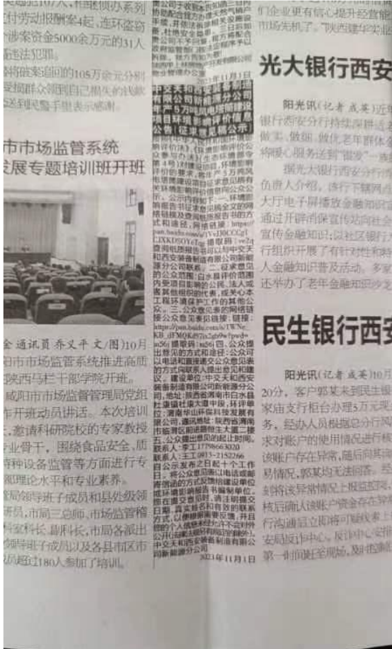
图3 项目征求意见稿报纸公示截图